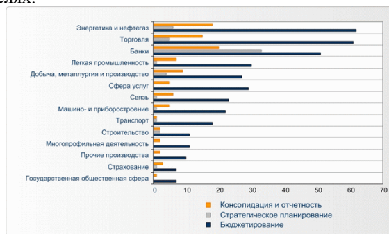
Рис. Статистика внедрений BPM-функциональности в разрезе отраслей

На следующем рисунке приводится статистика завершенных внедрений тех или иных функций BPM в разных отраслях.