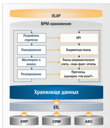
Рис. Архитектура BPM

В основе BPM-систем лежат хранилище данных (Data Warehouse, DWH). Данные при загрузке в хранилище очищаются и консолидируются. Собранная в DWH информация обрабатывается специализированными приложениями для планирования, управленческого учета, моделирования и поддержки других BPM-процессов. Контроль, анализ и выпуск отчетов на всех этапах управления эффективностью обеспечивается средствами оперативной аналитической обработки данных OLAP (On-line Analytical Processing).